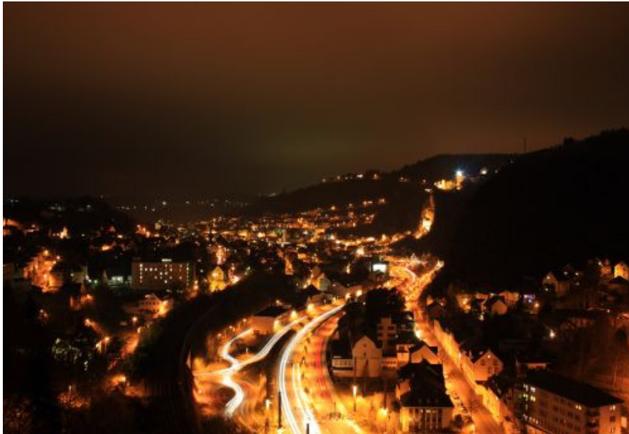
1. Platz M. Fels